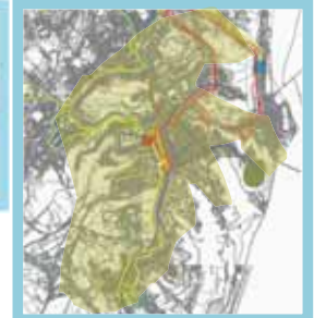
Área de Intervenção - planalto