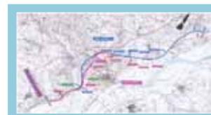
Desvio da linha do norte