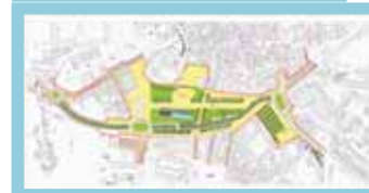
Requalificação do centro