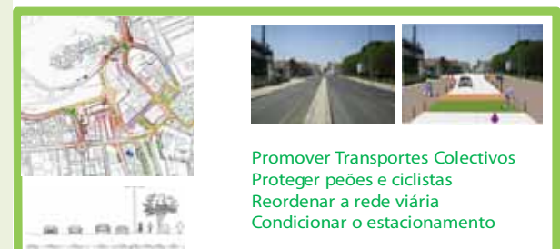
Promover Transportes Colectivos Proteger peões e ciclistas Reordenar a rede viária Condicionar o estacionamento