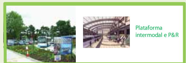
Plataforma intermodal e P&R

Câmara Municipal de Santarém (Urbanismo + Obras e Vias) Operadores de Transportes Públicos Institutos com ligações às questões da mobilidade sustentável (IMTT, ANSR) Associações locais Instituições de ensino Financiamentos do QREN Equipas pluridisciplinares/ Comissões de implementação