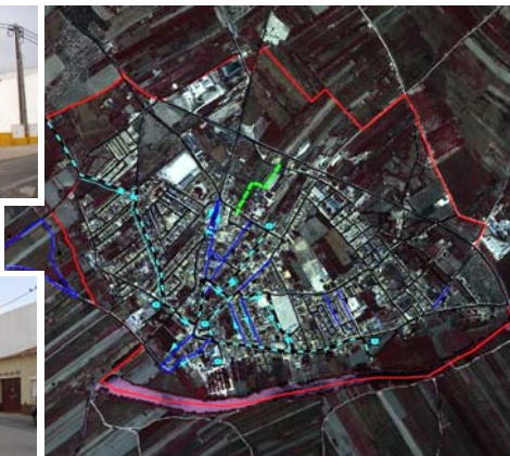
Vila da Golegã