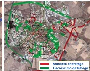
Novos tráfegos estimados em 2015